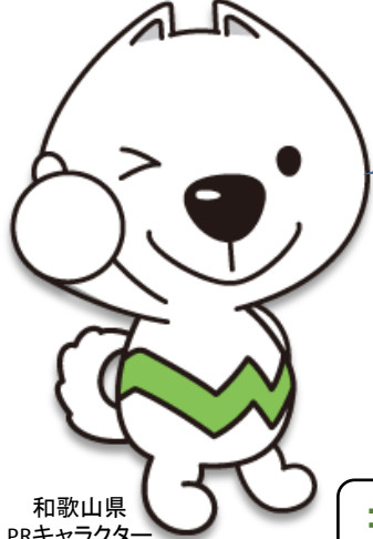
和歌山県 PRキャラクター 「きいちゃん」