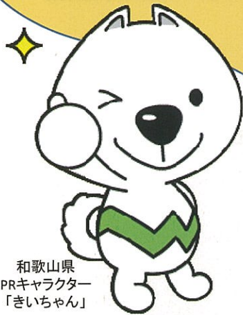
和歌山県 PRキャラクター 「きいちゃん」